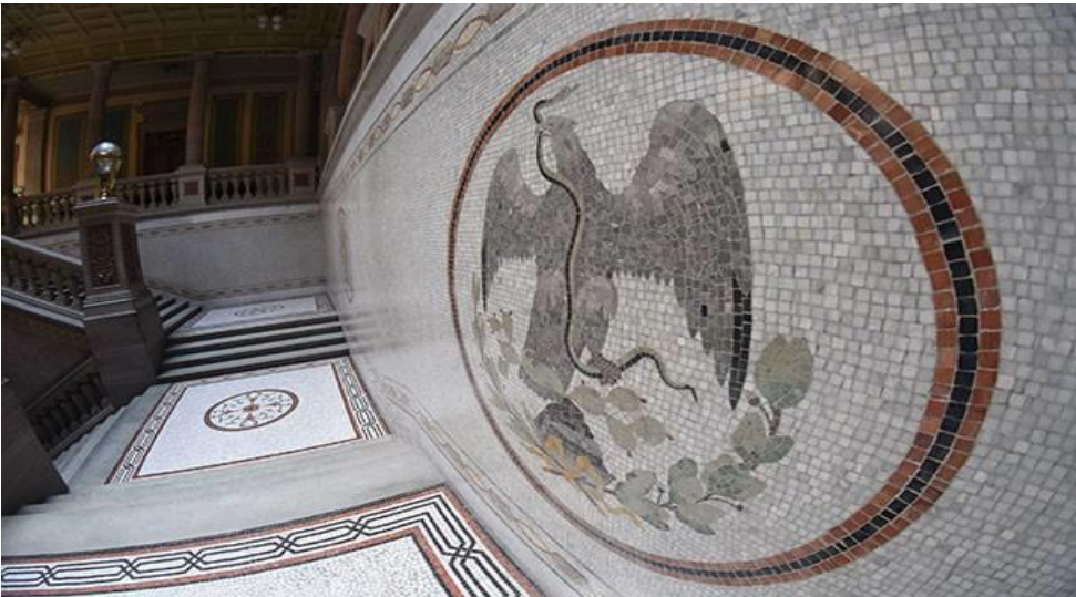
Interior del Palacio Legislativo de Guanajuato.